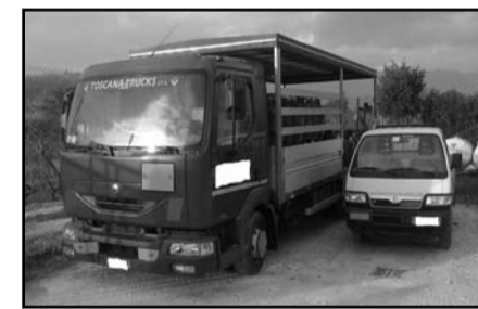
- Piaggio Porter S95LC, targato DY-----, imm. 2009, cc. 1296, al. B/gpl, cassone. Euro 13.000,00 - Renault Master, targato CD-----, imm. 2002, cc. 2188, al. Gasolio, furgone. Euro 8.000,00